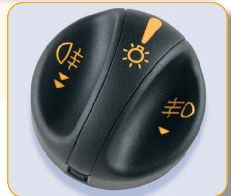
Marcado y Grabado